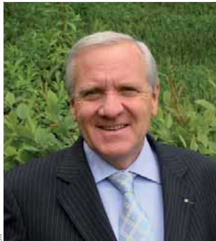
Le rapport du sénateur Alain Gournac met en avant la valeur ajoutée du modèle coopératif pour l'émancipation professionnelle et la santé au travail.

tirent plus que d'autres". Mais que feraient vraiment "ceux qui tirent plus" s'ils étaient seuls ? » Fait nouveau : le rapport Gournac, en s'intéressant aussi aux liens entre management participatif et santé au travail, marque une première reconnaissance écrite pour le modèle Scop. Il s'appuie sur une enquête (2) qui indique que « les médecins spécialisés en environnement au travail sont unanimes à établir une relation progressive entre le degré d'autoritarisme de la direction et la propension de l'entreprise à devenir un terrain propice aux pathologies ; et inversement, pour les établisse-