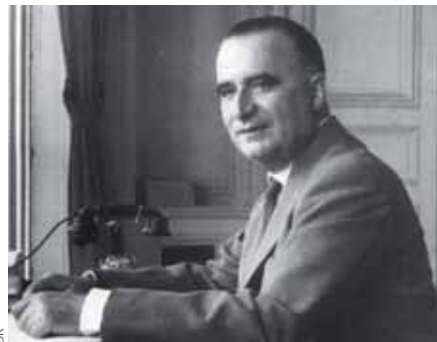
Contrairement au Général de Gaulle, Georges Pompidou, premier Ministre en 1967, n'a jamais cru aux vertus de la participation des salariés aux décisions de l'entreprise.

Le 11 juillet 1962, le Général de Gaulle s'entretient avec Alain Peyrefitte : « C'est bon que tous les français aient