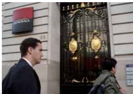
La Société Générale est l'un des groupes français où l'actionnariat salarié pèse le plus au capital. Mais c'est moins une mesure d'association du plus grand nombre aux décisions qu'une forme de protectionnisme contre les risques d'OPA hostiles.

Quant à l'actionnariat salarié, il commence à se développer, mais le phénomène est encore très récent, et seules quelques grandes sociétés l'ont réellement mis en œuvre, qu'elles soient non cotées comme Auchan, ou cotées comme la Société Générale, dont la presse a beaucoup parlé lorsque l'actionnariat salarié a permis d'éviter une prise de contrôle externe. Qui plus est, dans les grandes sociétés, l'actionnariat salarié est moins une mesure d'association du plus grand nombre aux décisions qu'une mesure de protectionnisme économique ou un instrument de compensation à la motivation existante pour le top management, comme l'illustre l'encouragement aux actions gratuites