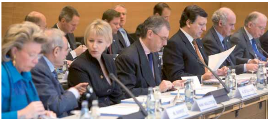
La Commission européenne est à l'initiative du nouveau statut de société coopérative européenne, adopté en juillet 2003.

Cette non-reconnaissance du secteur coopératif se double des handicaps que connaissent l'ensemble des PME, notamment l'existence de législations particulièrement contraignantes. Prévues depuis 1992 et progressivement mises en place depuis 2002, une disposition oblige les États membres à ouvrir les marchés publics aux entreprises ressortissantes de l'Union. Cependant, dans chaque secteur, il existe un seuil au-dessous duquel l'appel d'offres européen n'est pas